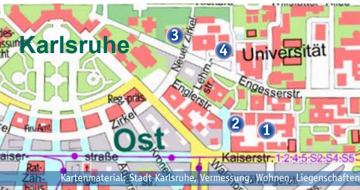
Kartenmaterial: Stadt Karlsruhe, Vermessung, Wohnen, Liegenschaften